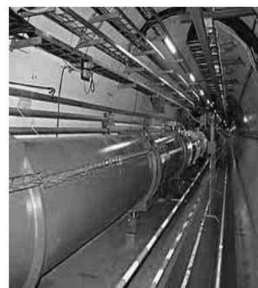
LHC IL PIÙ POTENTE ACCELERATORE

- Quanti anni ci vogliono per esperimenti co-