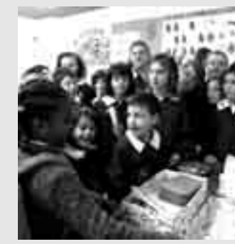
UN MOMENTO DI CONDIVISIONE CON LE SORELLINE ETIOPI

Due sorelline etiopi di sette e cinque anni, ospiti del Cara (Centro accoglienza richiedenti asilo) di Salinagrande, hanno portato una ventata di gioia e simpatia nella nostra scuola.