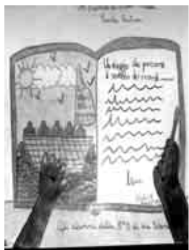
IL VIAGGIO IN UN'ALTRA CULTURA